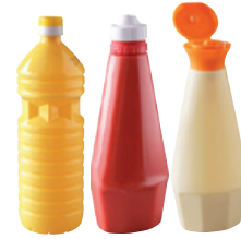
bouteilles d'huile, de sauce