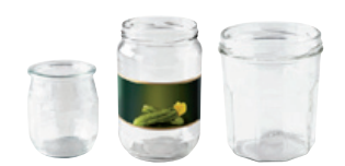
pots et bocaux