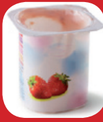
pots de yaourts et de crème