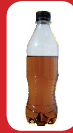
bouteilles non vidées