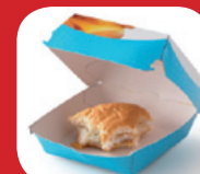
cartons avec des restes alimentaires à l'intérieur