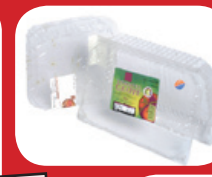
barquettes en plastique