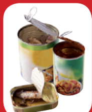
boîtes de conserve avec des restes alimentaires à l'intérieur