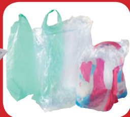
sacs et films plastiques