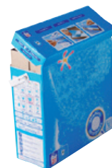
cartons de lessive