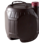
cubis de vin