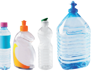
flacons de liquide vaisselle, vinaigrette