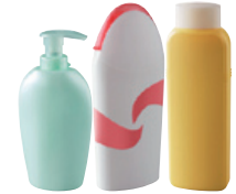
gels douche et shampoings