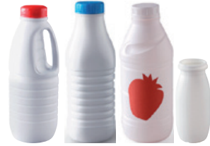
bouteilles de lait