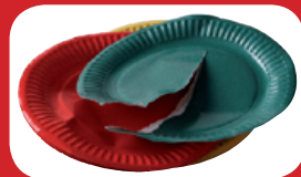
assiettes en carton