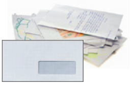
courriers, enveloppes, impressions