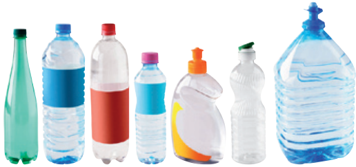
bouteilles d'eau, de soda